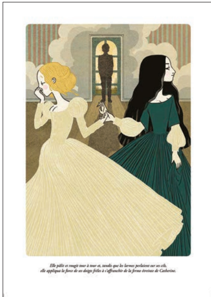
Image de Charlotte Gastaut pour « Les Hauts de Hurle-Vent », d'Emily Brontë, collection « Illustres Classiques », page 35 © L'école des loisirs, 2019

m'éloigner de l'univers que j'illustre habituellement.