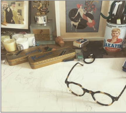
Le «petit monde de Charlotte» © Charlotte Gastaut

CHARLOTTE GASTAUT. – Je ne construis pas les premières images en pensant à la dernière. Je fais mes croquis au moment où je lis.