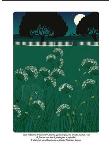
Image de Charlotte Gastaut pour « Les Hauts de Hurle-Vent », d'Emily Brontë, collection « Illustrés Classiques », page 83 © L'école des loisirs, 2019

Ce principe de l'illustration légendée est aussi un clin d'œil aux livres de notre enfance, dans lesquels on adorait retrouver les petites citations sous les images.