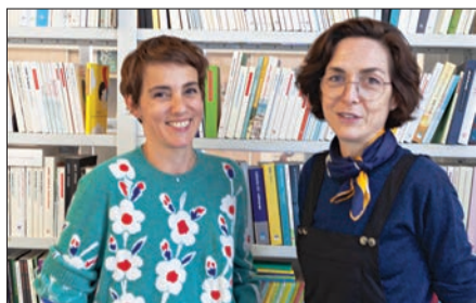
Charlotte Gastaut & Charlotte Moundlic © C.R.

Entretien avec Charlotte Moundlic & Charlotte Gastaut